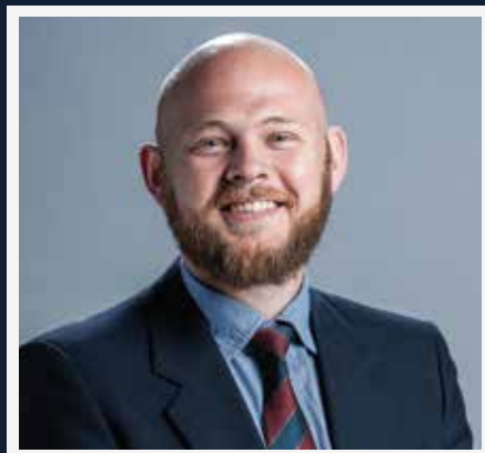
MNR. E ITTERSHAGEN-STRAUSS OP 0/18-AKADEMIESPAN SPANBESTUURDER