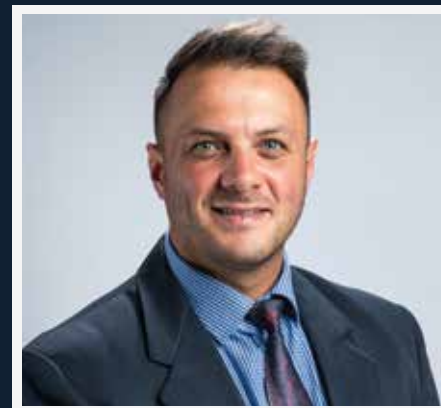
MNR. K ASPELUNG OP 0/18-AKADEMIESPAN AGTERLYNAFRIGTER